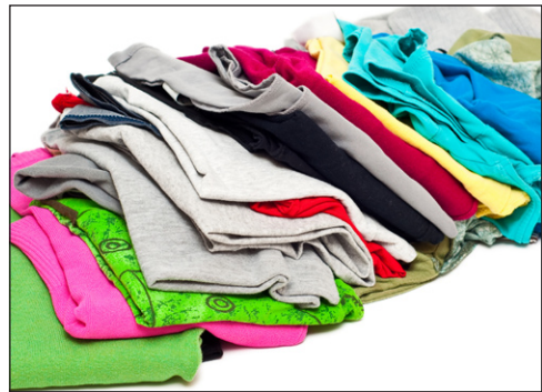
Jantzi egiten naiz.