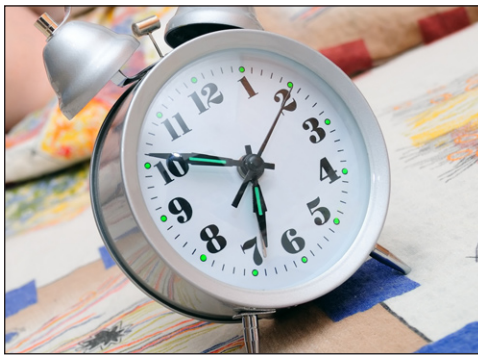
Goizero 7ak aldera esnatzen naiz.