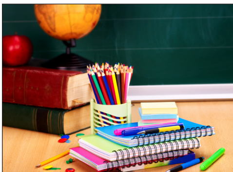
Eguna eskolan pasatzen dut.