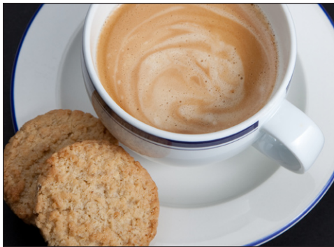
Egunero, kafea eta galletak gosaltzen ditut.